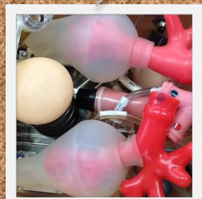
ほかほかにもリアルです。