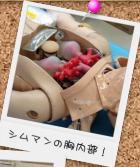
シムマンの胸内部！