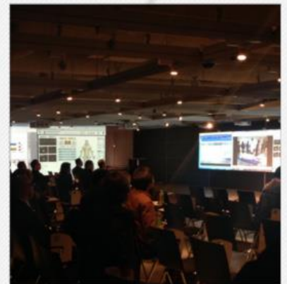
お洒落なデザインの講演会場！スクリーンはなんと9面！！