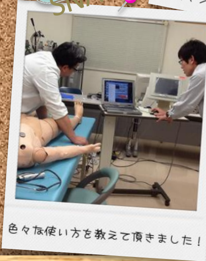
色々使い方を教えて頂きました！