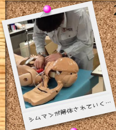
シムマンが解体されていく...