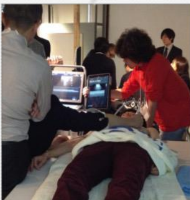
ABCDSonography LUNGのハンズオンセミナーの様子。

地下階では各社の最新シミュレーターの展示会が行われていました。これまでは再現が困難だった症例でも再現できるようになっていたり、人体の皮膚を透過させてその内側の筋肉や血液、神経などを見られるようにした3D画像シミュレーターなども登場していました。ハードもほとんどのものがワイヤレスなタイプやウェアラブルなものになっており、時代のニーズに合った形へと変化してきていました。他にも色々な切り口から考え作られた高機能なシミュレーターが多数あり、シミュレーション教育がそれだけ注目されてきているのだろうことが窺えました。