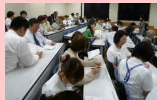
「ワークショップの様子」