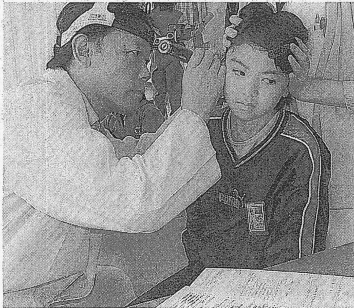
耳鼻咽喉科健診を受ける児童(成央小)