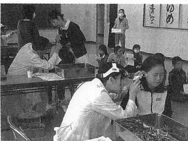
耳鼻咽喉科検診を受ける児童ら。平成二十三年度、成央小